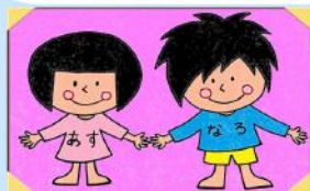
<マスコットキャラクター> あすちゃん&なろくん